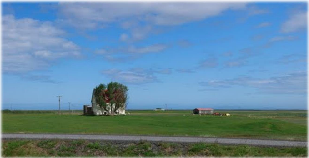
Mynd 3- Við Öxarfjörð eru mikil tækifæri