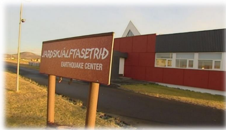
Mynd 4- Jarðskjálftasetrið er framtak öflugra íbúa