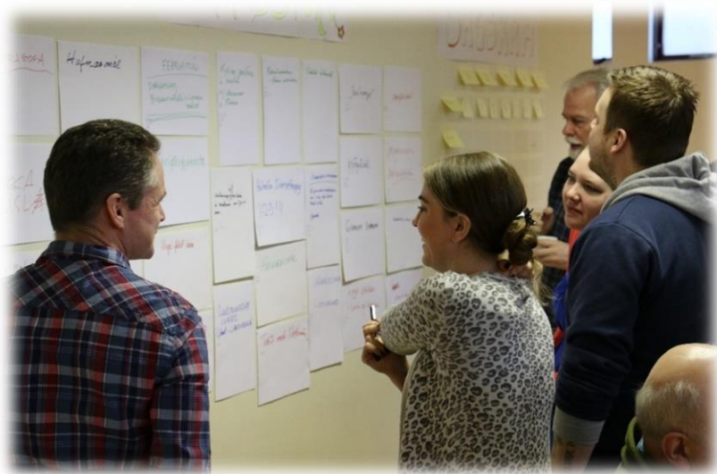
Mynd 1- Markmið og framtíðarsýn er að mestu byggt á niðurstöðum íbúþings en tekur jafnframt mið af greiningu á stöðu byggðarlagsins

Öxarfjarðarhérað er þekkt fyrir hágæða matvælaframleiðslu er byggir meðal annars á hugvitssamlegri og ábyrgri nýtingu á auðlindum héraðsins. Ferðaþjónusta er ört vaxandi atvinnugrein í héraði stórbrotinnar, fjölbreyttrar en viðkvæmrar náttúru. Hagsmunaaðilar í ferðaþjónustu hafa tekið höndum saman og skipulagt uppbyggingu með þarfir umhverfis og samfélags í huga, ekki síður en efnahagslegar þarfir. Uppbyggilegt og samheldið samfélag þar sem framfarir í atvinnulífi, ásamt öflugum innviðum, hafa leitt til jákvæðrar íbúáþróunar á verkefnistímanum.